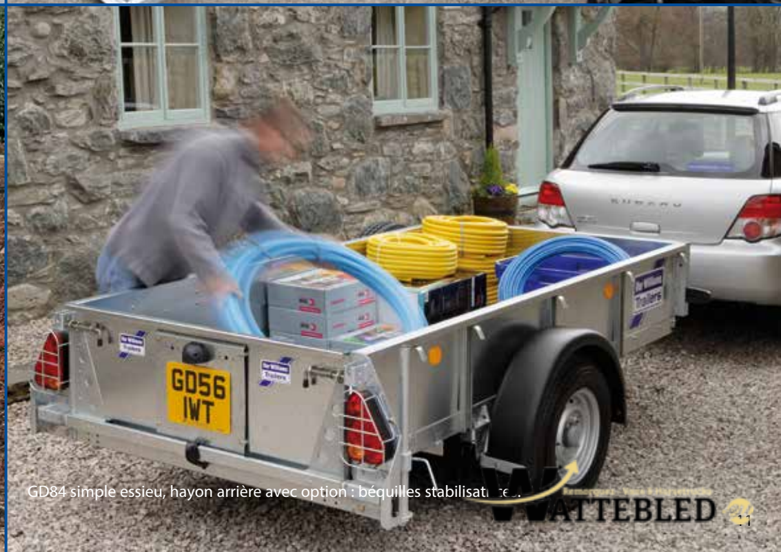
GD84 simple essieu, hayon arrière avec option : béquilles stabilisantes.