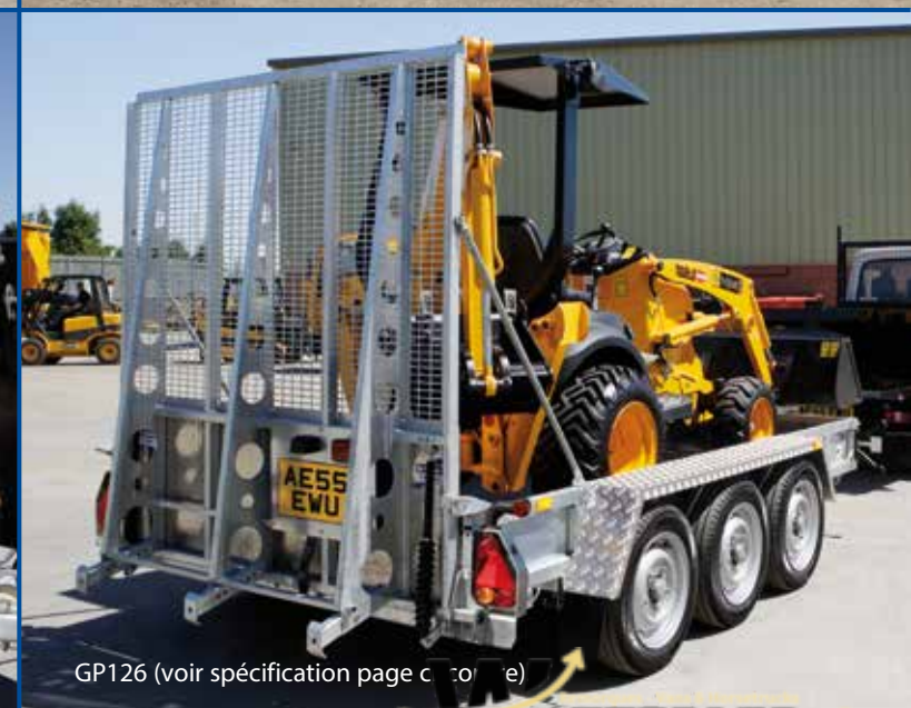
GP126 (voir spécification page ci-contre).