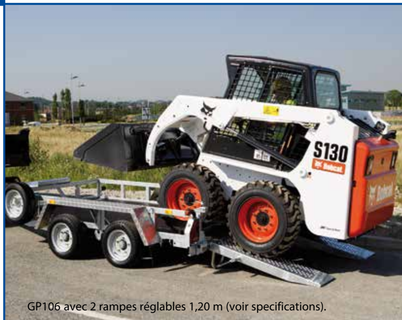
GP106 avec 2 rampes réglables 1,20 m (voir spécifications).

Les rampes larges, comme les rampes réglables, de tous nos porte-engins sont munies de béquilles automatiques intégrées. Cet équipement standard garantit la stabilité de la remorque lors du chargement/déchargement sans qu'il soit nécessaire de déployer des béquilles. Les remorques GP sont disponibles en ridelles hautes (GPH) ou basses (voir dimensions dans le tableau ci-dessus). Les GP à ridelles basses sont équipées de série de ridelles ouvertes (fermées en option) et d'un repose-godet. Les GPH à ridelles hautes sont livrées avec des ridelles fermées et un repose-godet est disponible en option. Cette option est idéale pour les utilisateurs recherchant la polyvalence : un porte-engin fiable offrant un bon volume utile pour une utilisation multi-usages.