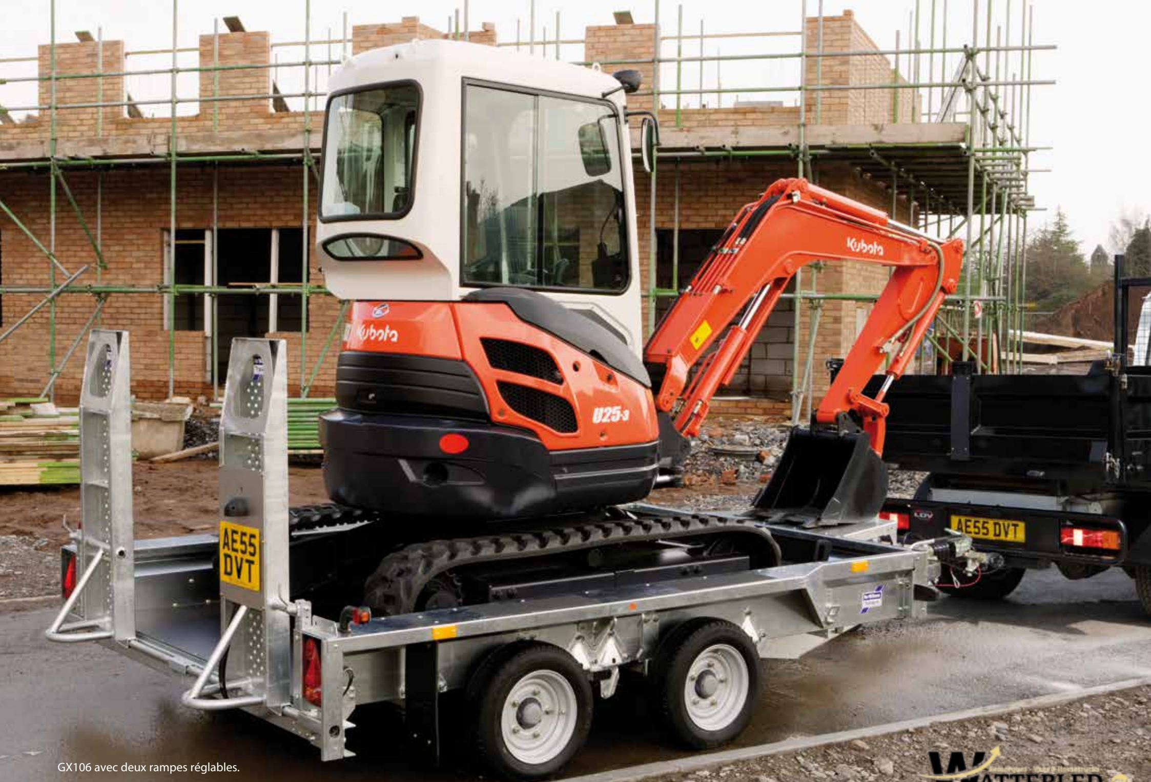
GX106 avec deux rampes réglables.