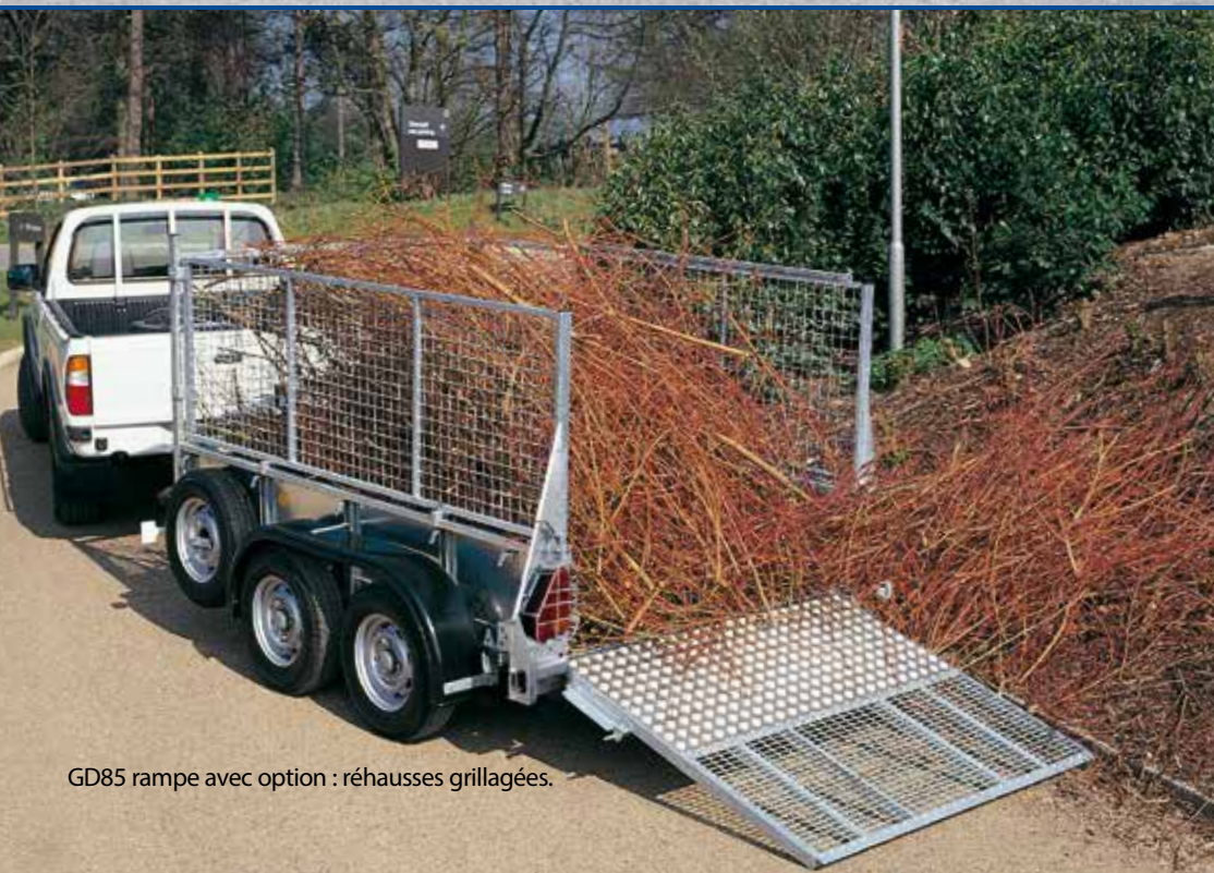
GD85 rampe avec option : réhausses grillagées.