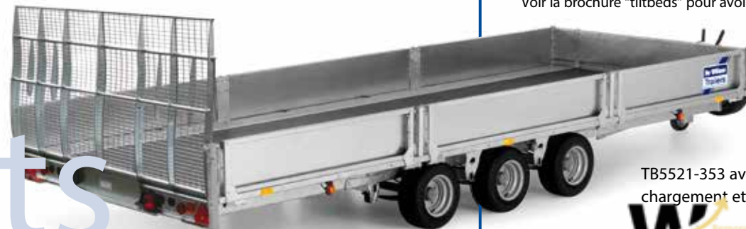
TB5521-353 avec rampe de chargement et des ridelles.

Voir la brochure "tiltbeds" pour avoir tous les détails (demandez votre concessionnaire)