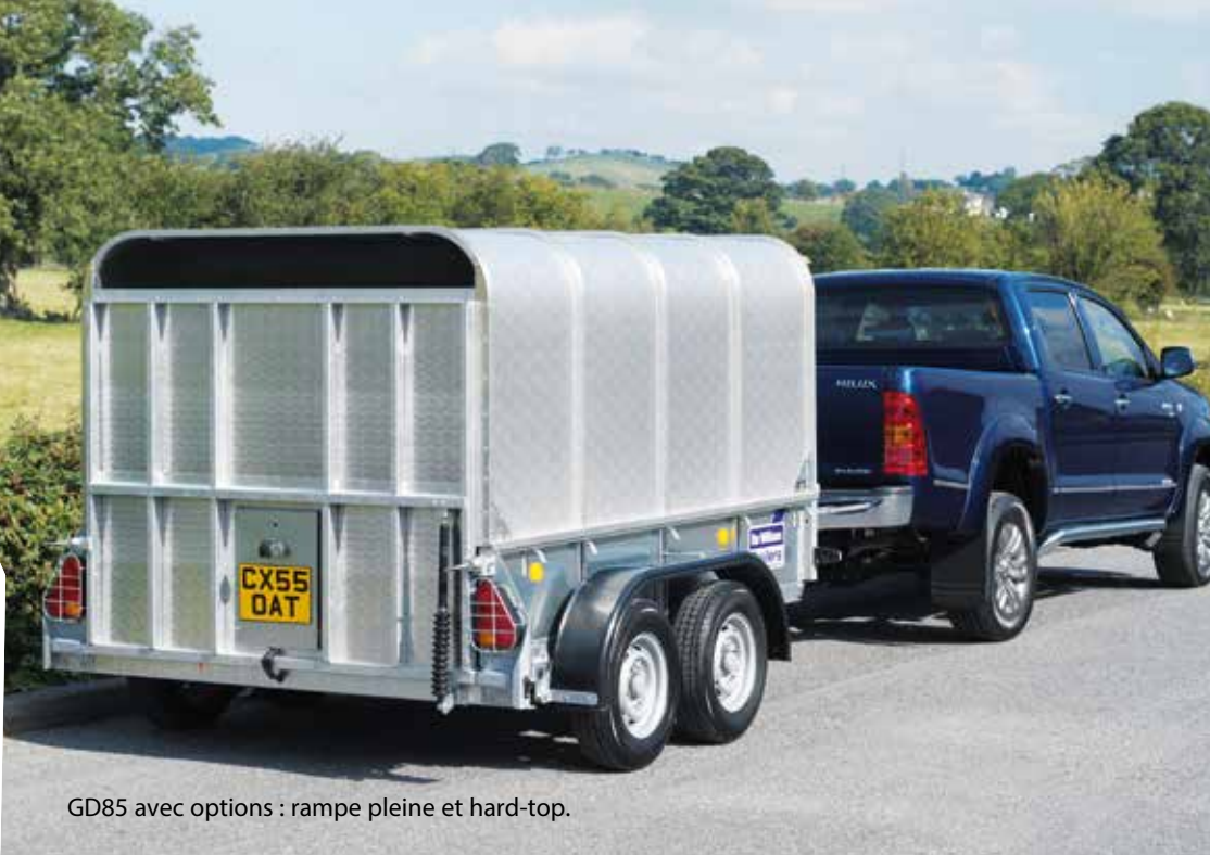
GD85 avec options : rampe pleine et hard-top.