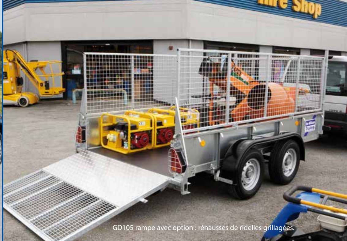
GD105 rampe avec option : réhausses de ridelles grillagées.