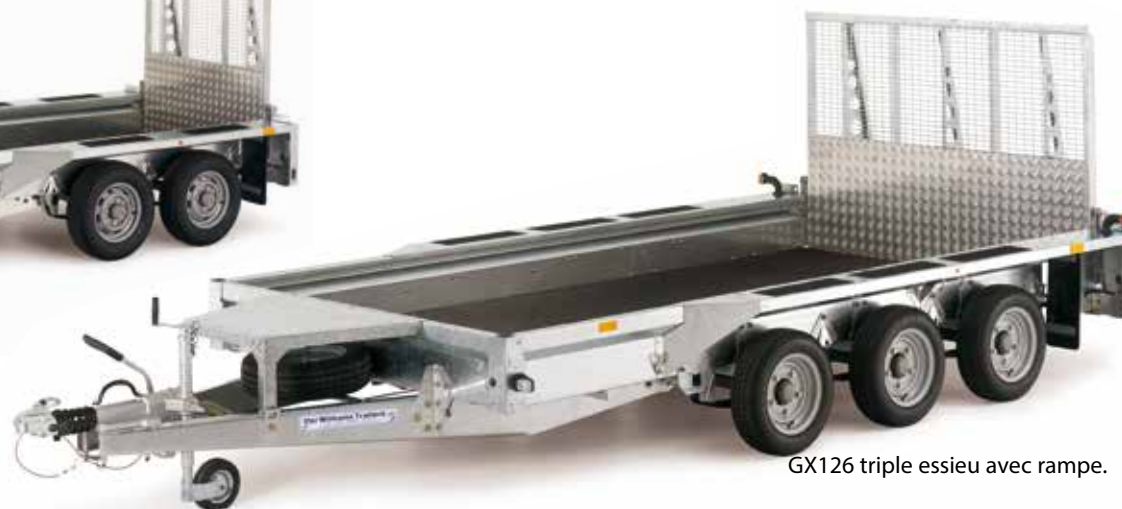
GX126 triple essieu avec rampe.