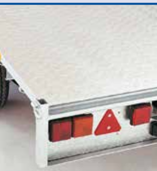
Revêtement de sol