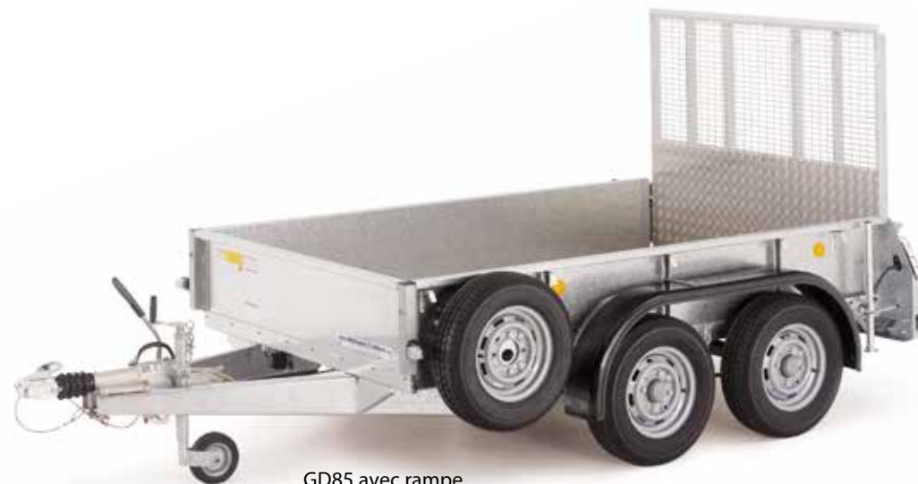
GD85 avec rampe.