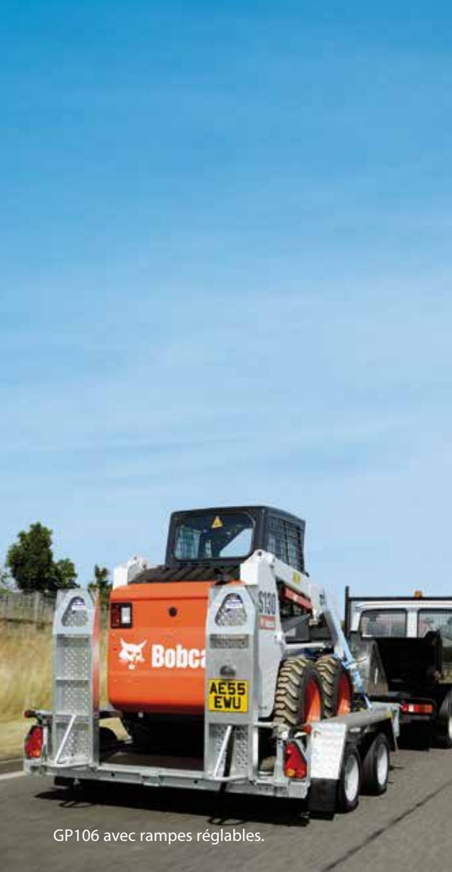
GP106 avec rampes réglables.

La conception des produits, les descriptions, les couleurs, les caractéristiques techniques etc. sont donnés à titre indicatif et peuvent varier à tout moment sans avis préalable. Comme nous nous efforçons constamment d'améliorer nos produits, il se produit de temps en temps des changements dans notre gamme ou sur certains modèles. Merci de vous assurer que les informations et caractéristiques techniques décrites dans cette brochure sont encore valables au moment où vous passez votre commande. Nos concessionnaires possèdent une connaissance approfondie de nos produits et seront heureux de vous aider à choisir votre remorque.