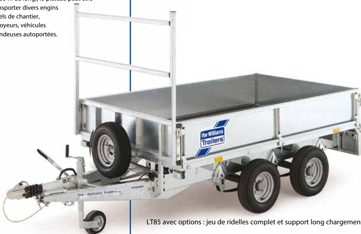
LT85 avec options : jeu de ridelles complet et support long chargement.