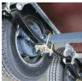
Essieu à poutre

Celles équipant les modèles GP/GH/GX sont réglables en largeur lorsqu'elles sont déployées.