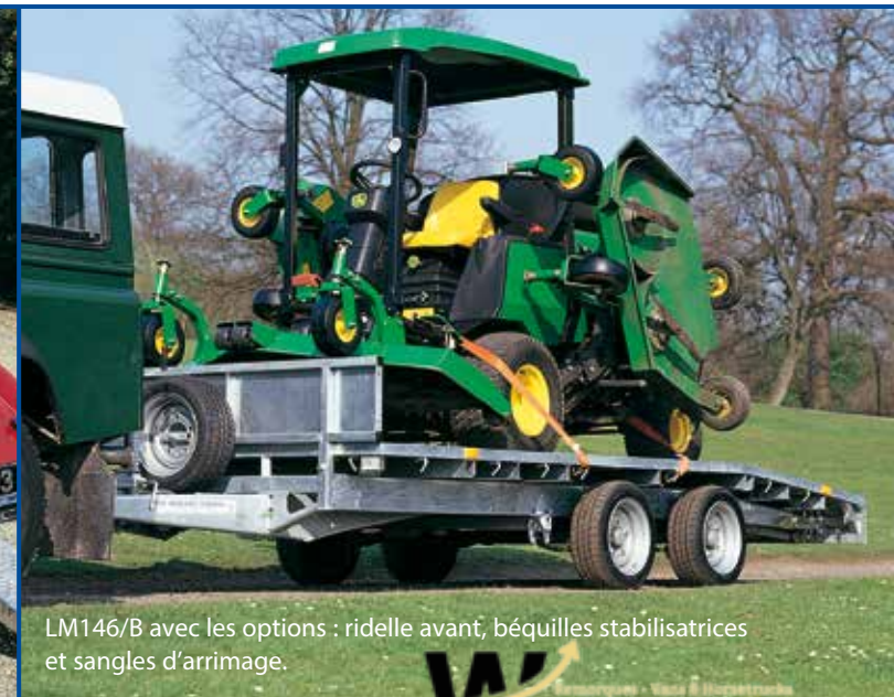
LM146/B avec les options : ridelle avant, béquilles stabilisatrices et sangles d'arrimage.