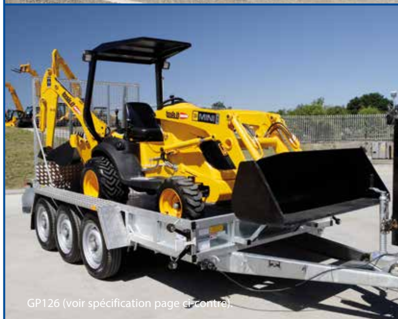
GP126 (voir spécification page ci-contre).