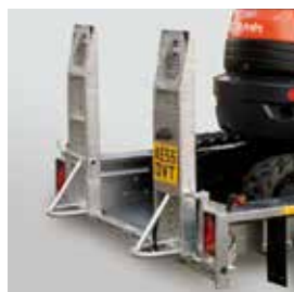
Rampes réglables de chargement, béquilles intégrées