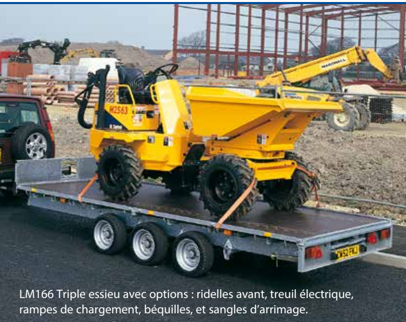
LM166 Triple essieu avec options : ridelles avant, treuil électrique, rampes de chargement, béquilles, et sangles d'arrimage.

Le PTAC pour la série LT va de 1 400 kg à 2 000 kg alors que pour la série LM, il va de 2 700 à 3 500 kg.