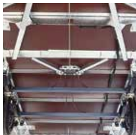
Châssis et plancher

C'est le souci du détail qui fait le succès des remorques Ifor Williams auprès de leurs propriétaires. Regardez plutôt les équipements de série que nous offrons.