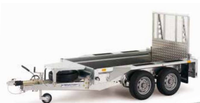
GX84 avec rampe.

Ces porte-engins sont équipés soit de deux rampes coulissantes, à écartement réglable, ou d'une rampe de chargement pleine largeur. Les dimensions s'échelonnent de la plus petite GX84 à la plus grande GX126. Ils peuvent être équipés d'accessoires tels qu'un support pour longs chargements, un « plancher aluminium » monté à l'usine, des rehausses de ridelles grillagées (à utiliser de préférence avec une rampe large), un nez de rampe boulonnable, des anneaux d'ancrage encastrés ou une rampe large ou une paire de rampes réglables en 1,80m de long au lieu de 1,20m. Un repose-godet est monté en série sur tous les GX. Les PTAC vont de 2700 à 3500kg. Les rampes larges, comme les rampes réglables, de tous nos porte-engins sont munies de béquilles automatiques intégrées. Cet équipement standard garantit la stabilité de la remorque lors du chargement/déchargement sans qu'il soit nécessaire de déployer des béquilles.