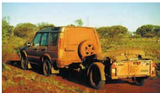
Une GD64G à l'oeuvre dans l'arrière pays australien

Nos remorques GD sont à l'aise dans presque tous les environnements possibles, avec pratiquement n'importe quel type de chargement, depuis les matériaux de construction jusqu'au matériel d'expédition.