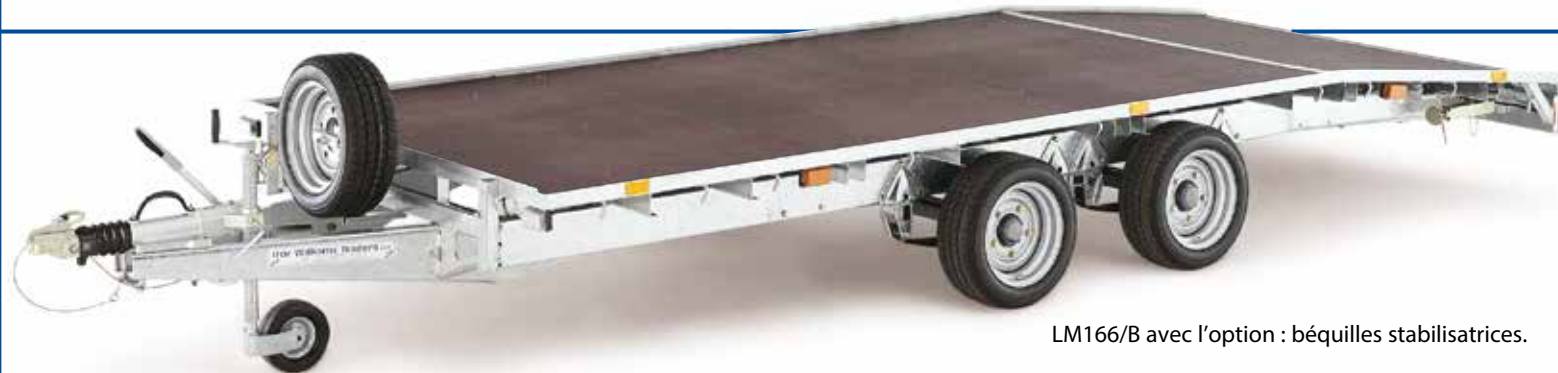
LM166/B avec l'option : béquilles stabilisatrices.

Il n'est pas recommandé de charger des véhicules ayant une garde au sol basse sur ce type de remorque.