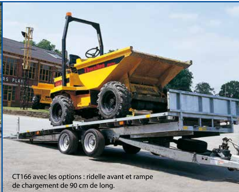
CT166 avec les options : ridelle avant et rampe de chargement de 90 cm de long.