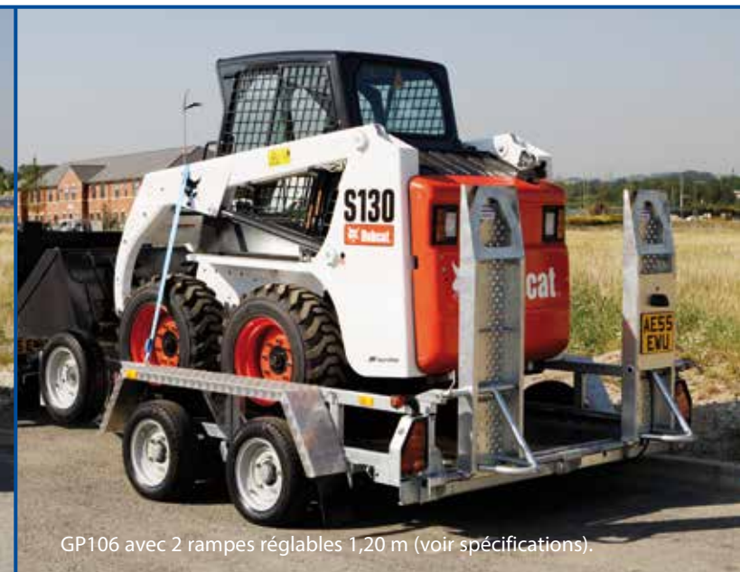
GP106 avec 2 rampes réglables 1,20 m (voir spécifications).