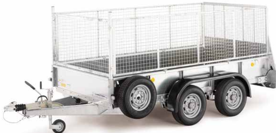
GD105 avec rampe et option : rehausses de rideaux grillagées.