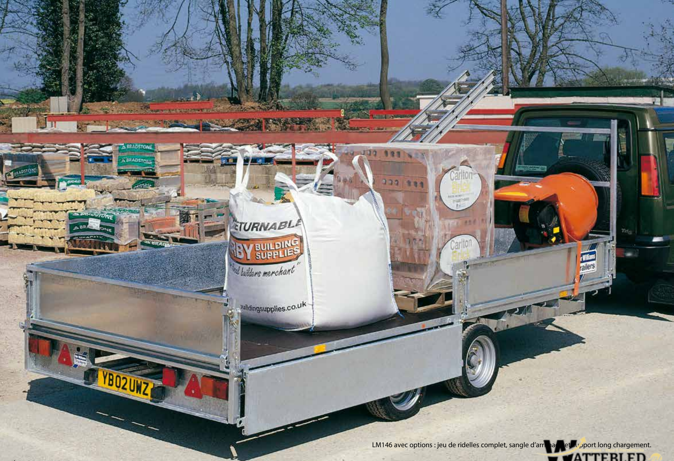
LM146 avec options : jeu de ridelles complet, sangle d'arrimage et support long chargement.