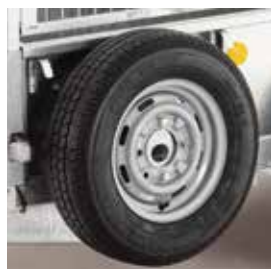
Roue de secours