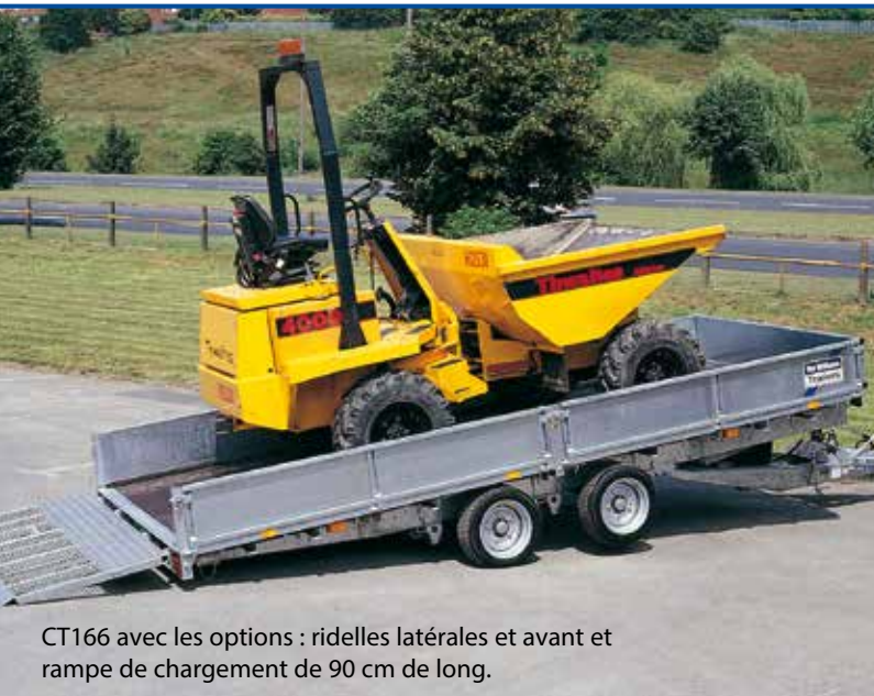
CT166 avec les options : ridelles latérales et avant et rampe de chargement de 90 cm de long.

En plus, on vous offre aussi une autre série de plateaux basculants (dont des triple-essieux!). Voir la brochure "tiltbeds" pour avoir tous les détails