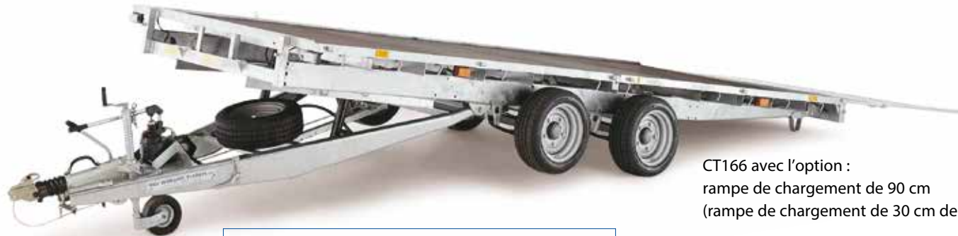
CT166 avec l'option : rampe de chargement de 90 cm (rampe de chargement de 30 cm de série).