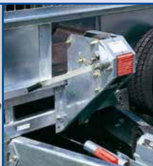
Treuil (manuel) freiné

Des bavettes, siglées lfor Williams, peuvent être montées sur les remorques des gammes LT/LM/GTB.