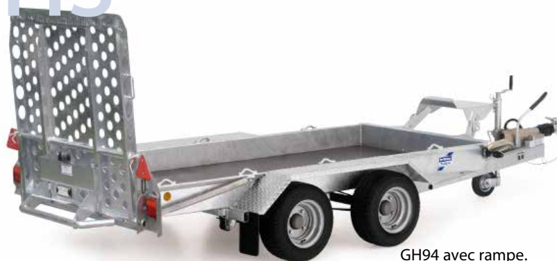
GH94 avec rampe.

La série GH est la plus jeune de nos porte-engins et est disponible en 6 dimensions.